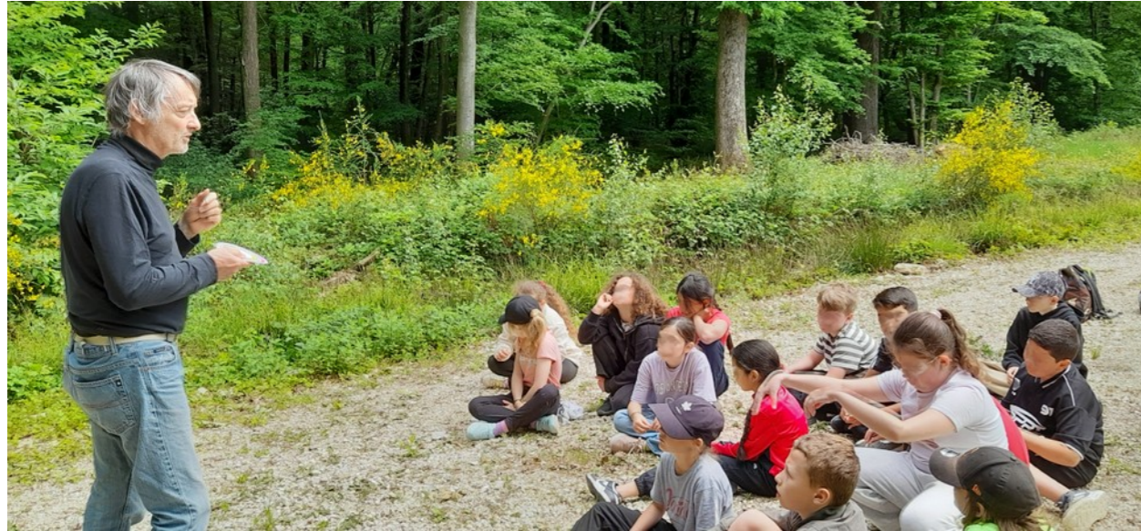
Animation forêt école Vigne Blanche