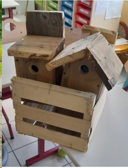
nichoirs fabriqués par ces enfants