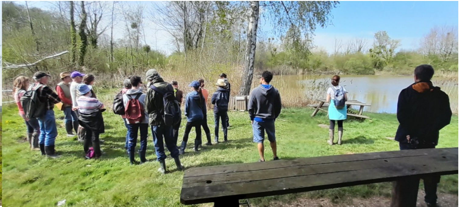
SORTIE MARAIS DE ST GOND