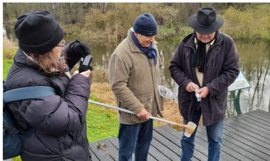
Animation Vigie eau à Plivot