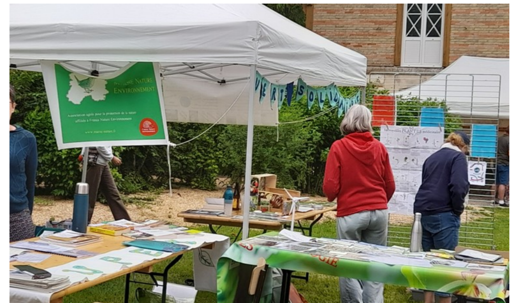
le 15 juin Fête de l'abeille à Courtisols