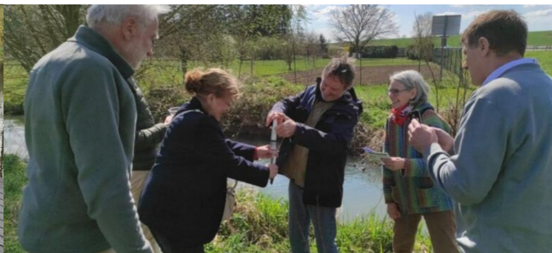
sur la Livre à Mareuil sur Ay